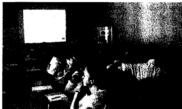
Spotkanie informacyjne dotyczące projektu „PI-PWPCouveusePL”