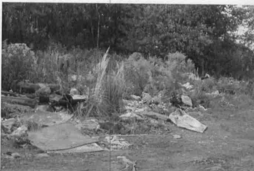
ul. Piłkarska; garaże BYTOM; 28.09.2017