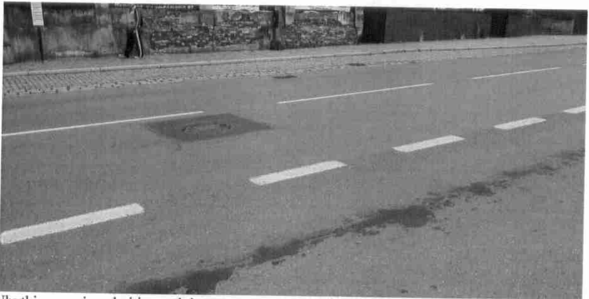
Ubytki w nawierzchni i zapadnięte wpusty ( w kompetencji MZDiM w Bytomiu) :